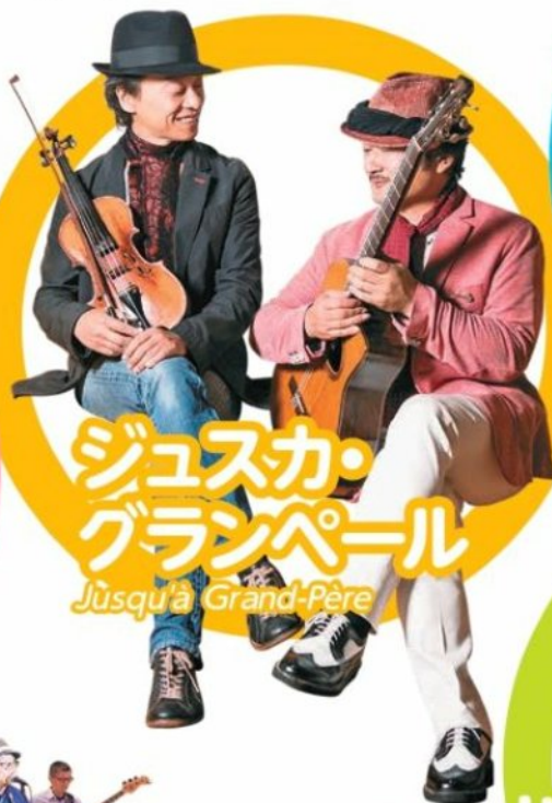
ジュスカ・ グランペール Jusqu'à Grand-Père