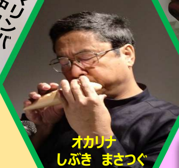
オカリナ しぶき まさつぐ