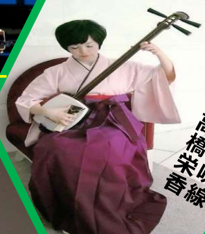
高橋三枝 津橋朱味香線